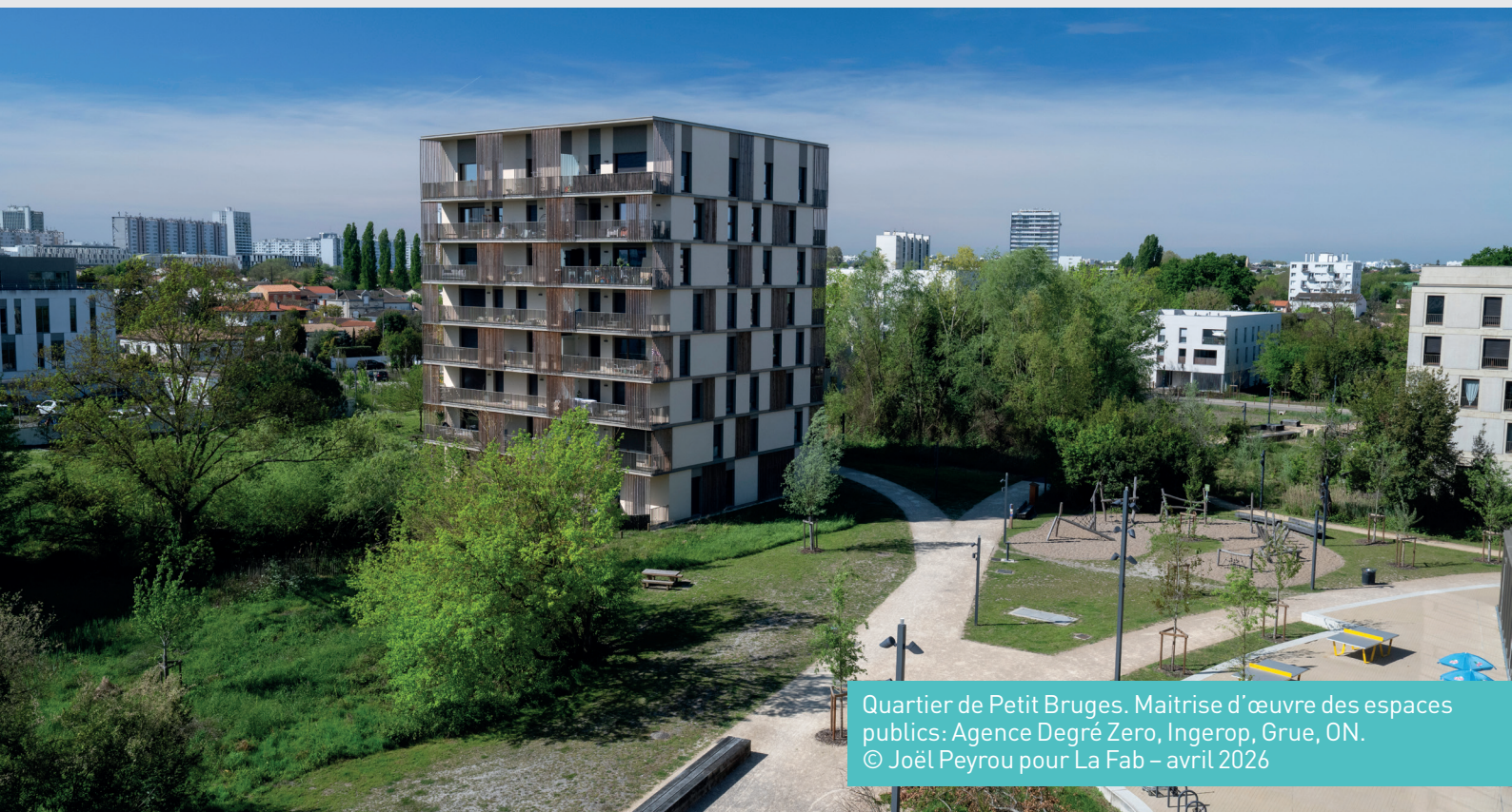
Quartier de Petit Bruges. Maîtrise d'œuvre des espaces publics: Agence Degré Zero, Ingerop, Grue, ON. © Joël Peyrou pour La Fab – avril 2026

s'arrêterait jusqu'à présent à la livraison, des bâtiments et des espaces publics. Pilotée par La Fabrique de Bordeaux Métropole (La Fab) et confiée à l'agence de conseil et expertise en économie urbaine Ibicity, cette étude réflexive et opérationnelle montre que les aménageurs ont un rôle clé à jouer, en articulant dès l'amont fabrique et fonctionnement, pour optimiser la gestion, rendre visibles les choix politiques d'entretien et interroger, à terme, la valeur économique mais surtout sociale des espaces publics.