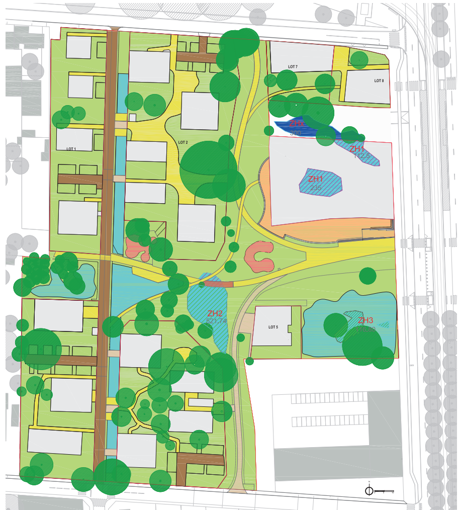
Plan de composition paysager de l'ilot "Petit Bruges".

Par ailleurs, pour répondre aux enjeux d'adaptation au changement climatique, les espaces publics sont de plus en plus verts et bleus, avec des arbres et des végétaux, et s'hybrident avec le grand cycle de l'eau. Le végétal est conçu comme une « machine hydraulique », avec une gestion des eaux pluviales qui est placée au cœur des projets, et des ouvrages de stockage des eaux pluviales qui sont réalisés à ciel ouvert (noues et bassins, plantés). Le sol joue également un rôle majeur – comme en témoignent les représentations des espaces publics qui sont désormais en coupe.