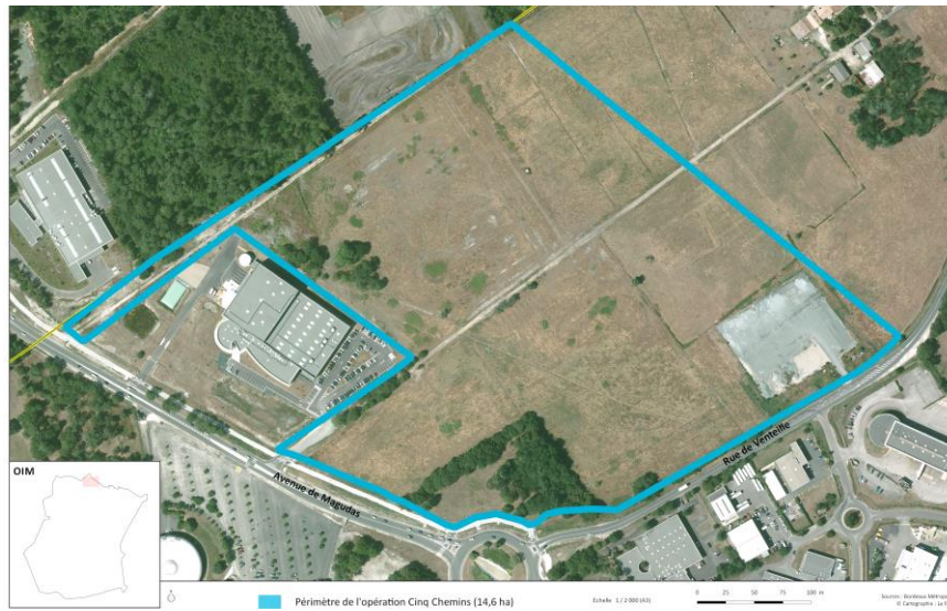
Plan de situation de l'opération d'aménagement Le Haillan – 5 chemins (La Fab)