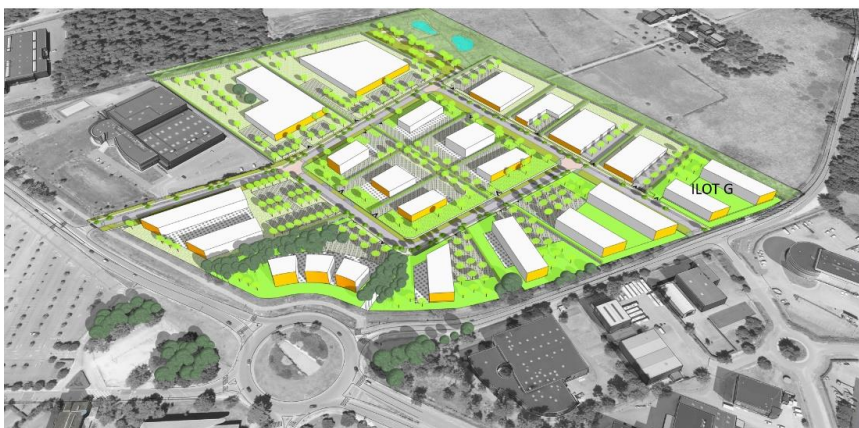
Axonométrie de l'opération d'aménagement Le Haillan – 5 chemins (Nechtan)