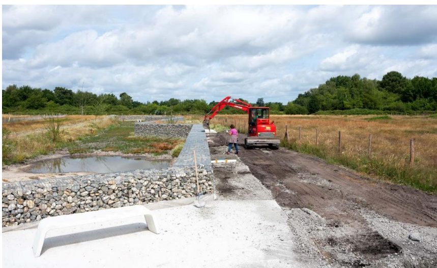
Travaux d'aménagement du bassin paysager (juin 2022)